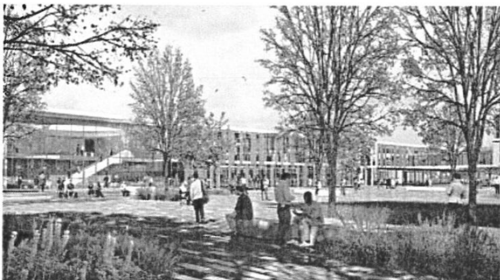
Les citoyens sont invités à s'exprimer sur le futur CHU de Caen Normandie du 3 juin au 21 juillet.

Il évoque aussi la nécessité d'un équipement informatique performant « pour un futur CHU qui sera numérique et digital ». Il s'interroge aussi sur les modèles à trouver pour mettre en place la circulation adéquate pour les équipes médicales et paramédicales « tant dans le futur CHU qu'à l'extérieur au sein du Groupement hospitalier de territoire ». Il évoque aussi de nouveaux modèles à expérimen-