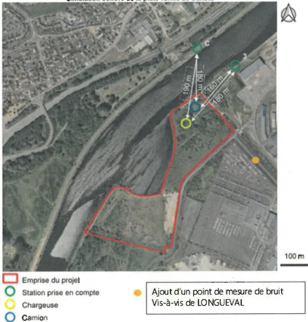
Simulation sonore de la plate-forme de transit.