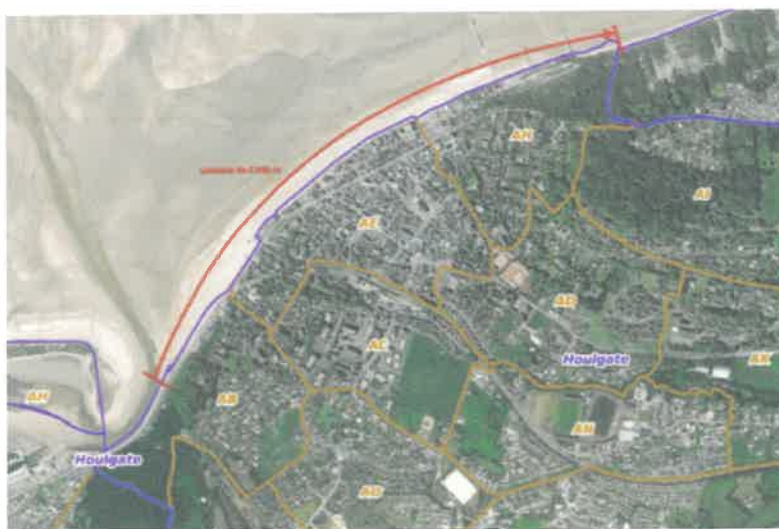
Périmètre de la plage, à gauche côté ouest, La Dives (petit fleuve)

Lors des périodes d'inexploitation, la commune est tenue d'enlever les installations démontables implantées dans le périmètre de la plage y compris les cabines toilettes.