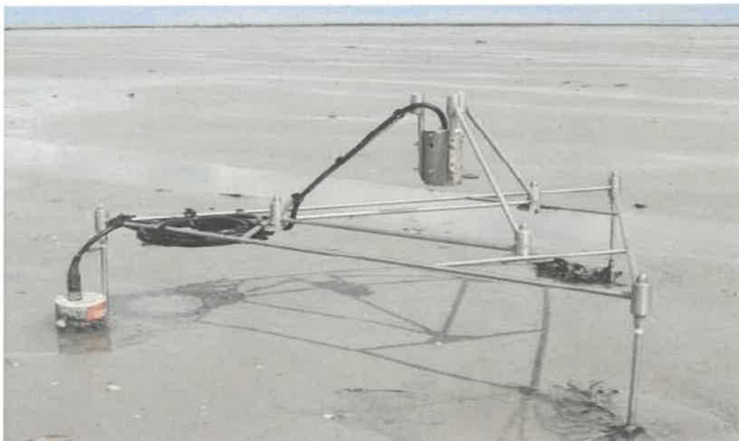
Figure 4 : Altimètre haute fréquence implanté sur un estran