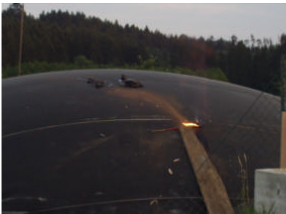
Image 9: 5. Test de feu avec une torche : fuite de biogaz par le trou fait par la combustion de la torche; un chiffon enflammé est utilisé pour être sûr que le gaz prend bien feu.