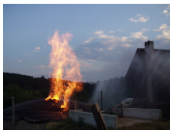
Image 12 + 13: 6. L'essence brûle, le gaz fuit et s'enflamme à son tour