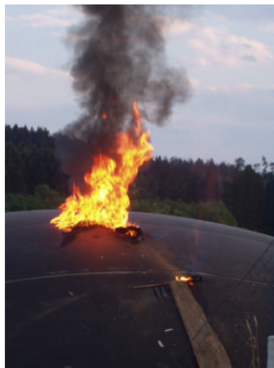
Image 10 + 11: 6. Un chiffon imbibé d'essence, enflammé, est jeté sur la membrane de stockage