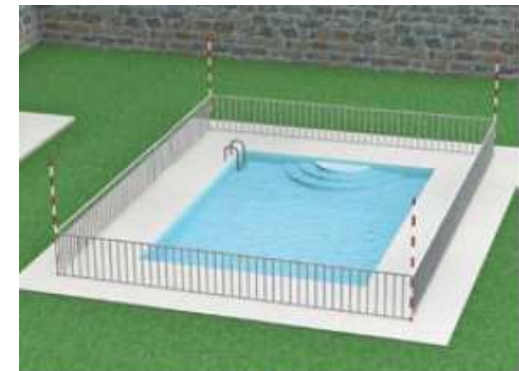
Piscine privée équipée d'une barrière de sécurité