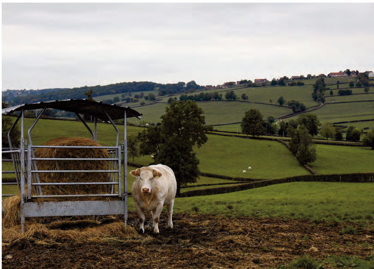
La réforme de la PAC en un coup d'œil